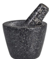
Mini mortero c/mano granito CLM.H112032 Unidades de Caja: 4 PVP recomendado: 17,95€

Enjuague con agua tibia y deje secar, no usar jabón