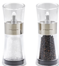
Set Molinillos Sal i Pimienta FLIP INVERTA 15,4cm. CLM.H581780 6x6x15 cm Unidades de Caja: 4 PVP recomendado: 44,95€