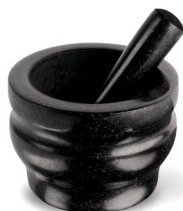
Mortero c/mano granito CLM.H100279 15x15x10,5 cm Unidades de Caja: 2 PVP recomendado: 39,95€