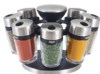
Carrusel 8 especias/hierbas CAMBRIDGE CLM.H121807 20,7x20,7x13,5 cm Unidades de Caja: 2 PVP recomendado: 64,95€