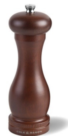
Molinillo Pimienta CAPSTAN Forest 16,5cm. CLM.HB0644P 5,8x5,8x16,5 cm Unidades de Caja: 4 PVP recomendado: 21,95€