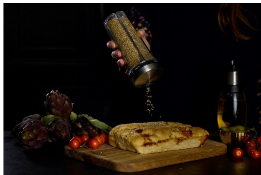
Especiero c/ 3 posiciones CLM.H121817SR Unidades de Caja: 16 PVP recomendado: 3,95€